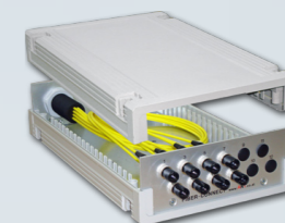
Hutschienen-Patchfeld für max. 12 Fasern